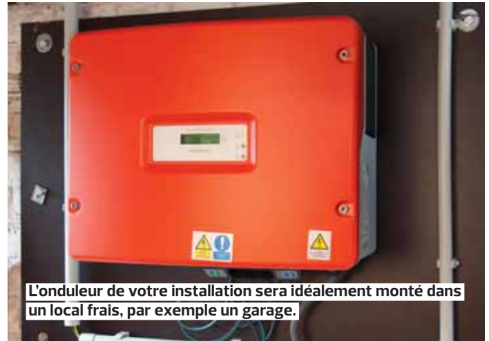
L'onduleur de votre installation sera idéalement monté dans un local frais, par exemple un garage.

différentes marques de panneaux et l'installateur peut proposer des postes supplémentaires (l'adaptation de l'installation électrique ou un dispositif de protection contre les surtensions, p.ex.). Informez-vous donc le plus complètement possible.