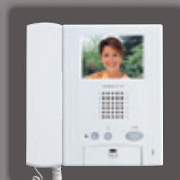
GH-HS + GH-1KD